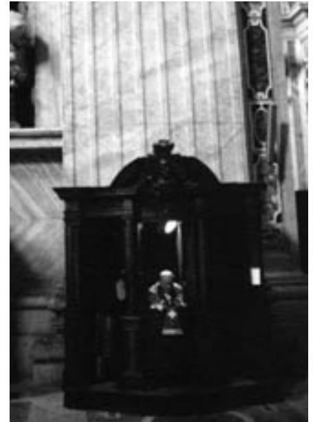
Er war der Papst der Barmherzigkeit und liebte das Sakrament der Vergebung: Johannes Paul II. in einem Beichtstuhl seiner „Pfarrkirche“, des Petersdoms.

- Versuchen Sie, zehn Minuten am Tag zu finden. Es lohnt sich. Vielleicht schauen Sie einfach zehn