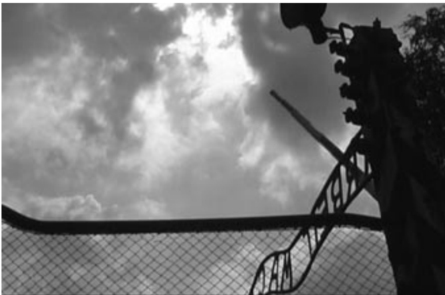
Der Großvater meiner dänischen Frau musste ins Konzentrationslager

Gleich auf der ersten Seite präsentiert uns Frisch den Soldaten, dem er im weiteren Verlauf der Ereignisse Eigenschaften wie Aufsässigkeit, Trunksucht, Ungerechtigkeit, Aggressivität, Vergewaltigung und schließlich Landesverrat andichtet.