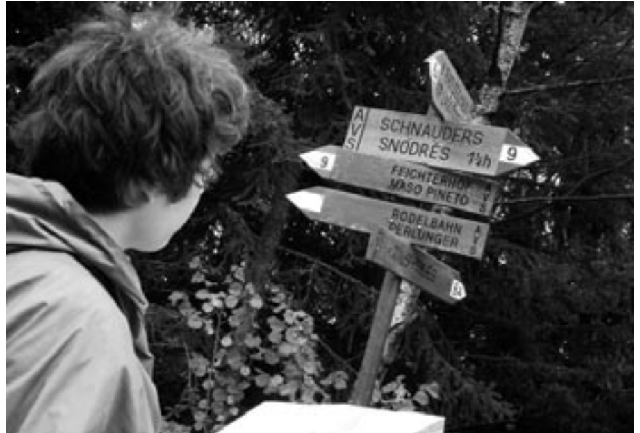
Frisch schleicht sich in die altersspezifische Problematik unserer Jugendlichen ein und versucht die positive Bedeutung von kultureller Verwurzelung zu zerstören.

Mit der Figurenkonstellation Barblin-„Jud“ schleicht sich Frisch in die altersspezifische Problematik seiner jugendlichen Leserschaft ein. Auch die kennt das Empfinden, von