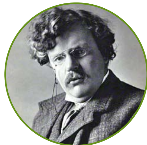
Gilbert Keith Chesterton (* 29. Mai 1874, † 14. Juni 1936)

Die heutige Situation ähnelt über weite Strecken der Frage, mit der sich der russische Schriftsteller Wladimir Solowjew in seinem Buch Kurze Erzählung vom Antichrist auseinandersetzt. Allerdings wird heute auch die Identität des Menschen selbst angegriffen, nachdem die christliche Religion mit ihrem Anspruch, in der Welt ein entscheidendes Wörtchen mitzureden, an den Rand gedrängt