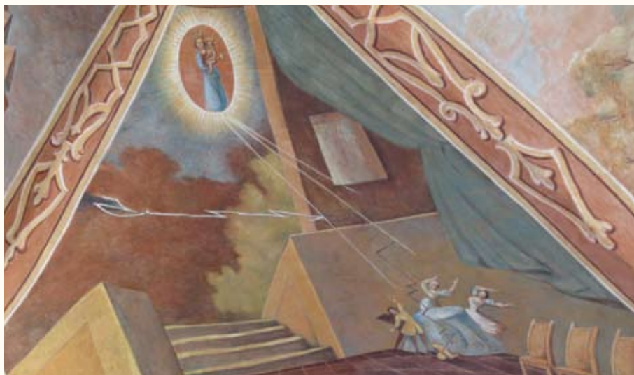
Fresko aus der Loretokirche, Svata Hora Pribram. In dieser Kriche wird Maria als Hilfe der Christen verehrt

Die Gefahr heute ist jene des Abfalls vom christlichen Glauben, und