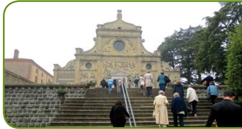
Die Freitreppe als Zugang zur Basilika der Abtei. Das Kloster wurde 1806 säkularisiert. Nach dem Anschluss Venetiens an Italien kehrten die Benediktinermönche zeitweise zurück, endgültig erst 1904.