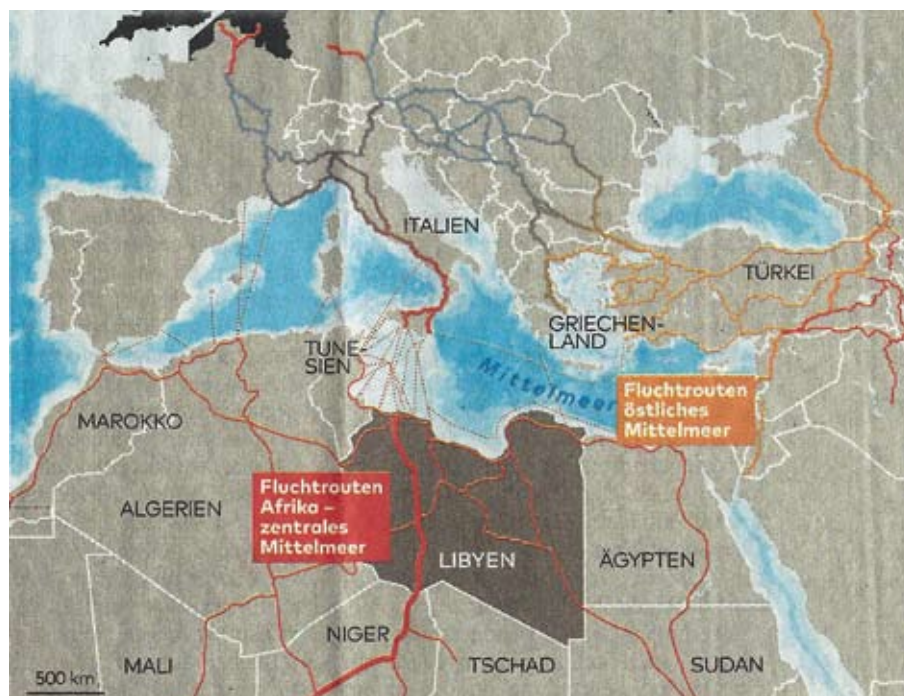
Die Fluchtrouten aus Afrika und Nahost zum Mittelmeer: Im Moment verlagern sich die Schwerpunkte nach Nordwestafrika, Richtung Maghreb und die Meerenge von Gibraltar.

Rabat will die Polisario isolieren, Algier hält dagegen. Aber der Einfluss Algeriens in Afrika sinkt, Marokkos Ansehen steigt. Das zeigten auch die Umstände der Rückkehr Marokkos in die OAU. Dass die Schwergewichte Südafrika, Nigeria, Angola, Algerien und Kenia einen Aufschub beantragten, manifestierte zwar, wie mäch-