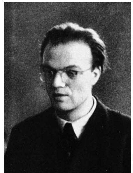
Alfred Delp SJ , Am 2. Februar 1945 wurde Delp in Berlin-Plötzensee als Mitverschwörer im Kreisauer Kreis gehängt.

dass die weltliche Grundlage sich von sich selbst abhebt und sich ein selbständiges Reich in den Wolken fixiert, ist nur aus der Selbstzerrissenheit und Sichselbstwidersprechen dieser weltlichen Grundlage zu erklären. Diese selbst muss also in sich selbst sowohl in ihrem Widerspruch verstanden als praktisch revolutioniert werden. Also nachdem z.B. die irdische Familie als das Geheimnis der heiligen Familie entdeckt ist, muss nun erstere selbst theoretisch und praktisch vernichtet werden“. Die Vernichtung der Familie war und ist das Ziel des Marxismus. Dieses sein Programm ist ge-