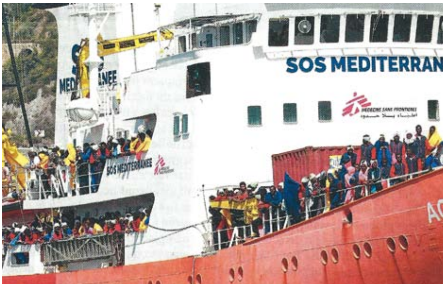
Durchbrechen immer wieder die Festung Europa: Ankunft eines Schiffes einer Flüchtlingshilfsorganisation mit Geretteten an Bord in Italien

Diese Erinnerungsbotschaft des heiligen Jahrtausendpapstes war auch eine Mahnung und Warnung, weil die Europäer damals in der Charta der Grundrechte der Europäischen Union „nicht einmal einen Bezug auf Gott eingefügt“ hatten. Diese Gottvergessenheit und Ablehnung Gottes, mithin Ablehnung der Identität Europas, könnte das Schicksal des alten Kontinents besiegeln – wenn sie denn andauert. Der Umgang mit dem Islam aber könnte auch zum Erwachen beitragen. Das Menetekel galt dem frevelhaften König Belschazzar und seinem Reich, nicht den Israeliten und den Völkern. Mit Erdogan oder ande-