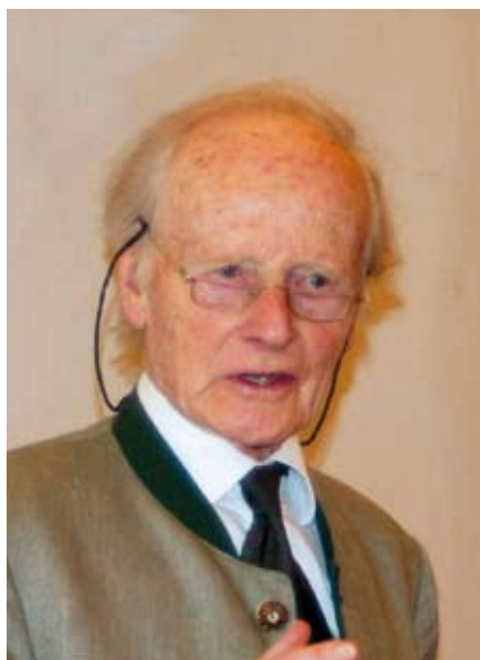
Robert Spaemann (* 5. Mai 1927 in Berlin) ist ein deutscher Philosoph. „Der Ungläubige nimmt die Welt hin und kapituliert vor dem Sinnlosen. Der Gläubige behält das Vertrauen in die Sinnhaftigkeit des Seins“.

sei nur zu wahren, wenn die Geburten vor allem in den armen Ländern drastisch und mit allen Mitteln reduziert würden. Das ist übrigens auch eines der Motive für die Propagierung von gleichgeschlechtlichen Beziehungen. Aus der Angst um die „Bevölkerungsexplosion“ ist in vielen reichen Ländern eine „Bevölkerungsimplosion“ geworden. Die Geburtenrate ist so weit gesunken, dass die Generationen nicht mehr ersetzt werden. Wir sind sterbende Völker geworden. Es ist weniger die Überalterung das Problem als die „Unterjüngung“, um eine Wortbildung von Prof. Dr. med. Ot-