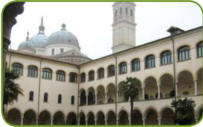
Einer der vier Kreuzgänge in der Abtei von Praglia. Die Abtei beherbergt die Biblioteca del Monumento Nazionale di Praglia, die aus der mittelalterlichen Klosterbibliothek hervorgegangen ist.