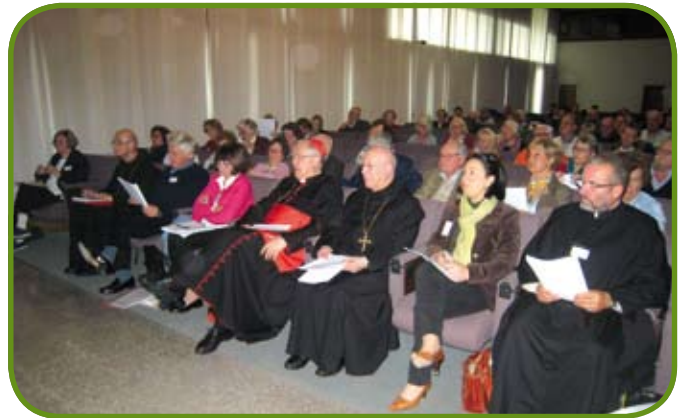
Am Fuß der euganeischen Hügel in der Provinz Padua fand ein Teil der Jubiläumsfeierlichkeit in der Abtei Praglia statt.

gen, unsere Identität und das sichere Umfeld kultureller Hegemonie bewahren zu können? Das Modell des Feindes wurde stillschweigend akzeptiert. Akzeptiert wurde das bürgerliche Modell (von einem Leben ohne Erschütterungen, das auch in den kleinsten Aspekten geplant ist und nie dem Willen Gottes überlassen wird – ersichtlich an der Tatsache, dass man sich nicht vorstellen kann, es existiere ein Modell für einen anders gelebten Alltag), dann die sexuelle Revolution, und jetzt die anthropologische Revolution. Davor kann man kaum die Augen verschließen. Im Übrigen kann das Christentum auch nicht auf Identität, Hegemonie oder Kultur reduziert werden; entweder es umfasst das ganze Leben oder es hat keinen Entfaltungsraum.