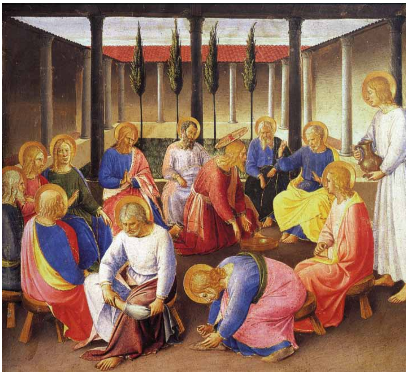
Seht die Demut Gottes! Schon vor seiner Passion wird der Gottessohn zum Diener aller, als er seinen Jüngern die Füße wäscht (Gemälde von Fra Angelico aus dem Jahr 1450 aus der Serie neutestamentlicher Szenen des Silberschranks (Armadio degli Argenti), heute im Museo San Marco, Florenz).

wurde, sollt ihr sagen: Wir sind unnütze Sklaven; wir haben nur unsere Schuldigkeit getan“ (Lk 17,10). Jesus wusste sehr genau um die Gefahr des Hochmutes, gerade auch bei den Aposteln, die immer wieder versucht waren, besondere Privilegien zu erhalten. Doch Hochmut steht absolut gegen das Reich Gottes. Er führt dazu, dass der Mensch sich von Gott abwendet, weil er meint, alles besser zu wissen, und er tötet auch die Liebe zum anderen, weil der Hochmütige den Mitmenschen ihre Gleichwertigkeit und Würde abspricht. ●