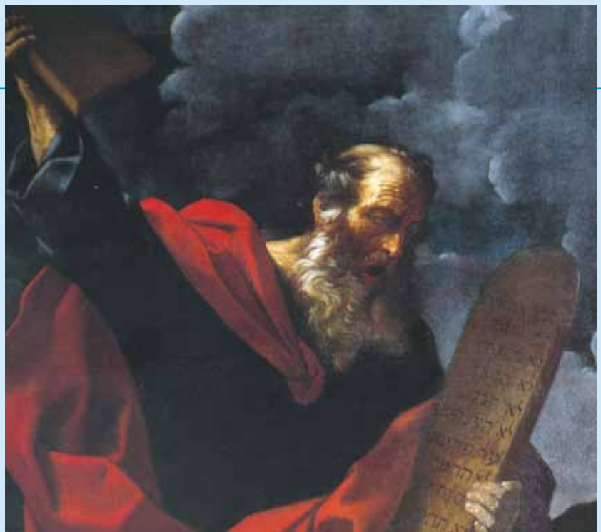
Moses mit dem Zehntafelgesetz. Wenn es beachtet wird, sind die Beziehungen zu Gott und den Menschen geordnet