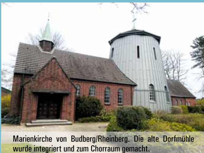
Marienkirche von Budberg/Rheinberg. Die alte Dorfmühle wurde integriert und zum Chorraum gemacht.

Einer der ungewöhnlichsten Kirchtürme in Deutschland steht im Rheinberger Ortsteil Budberg am linken Niederrhein. Der Turm der katholischen St. Marienkirche ist eine fast 200 Jahre alte Mühle.