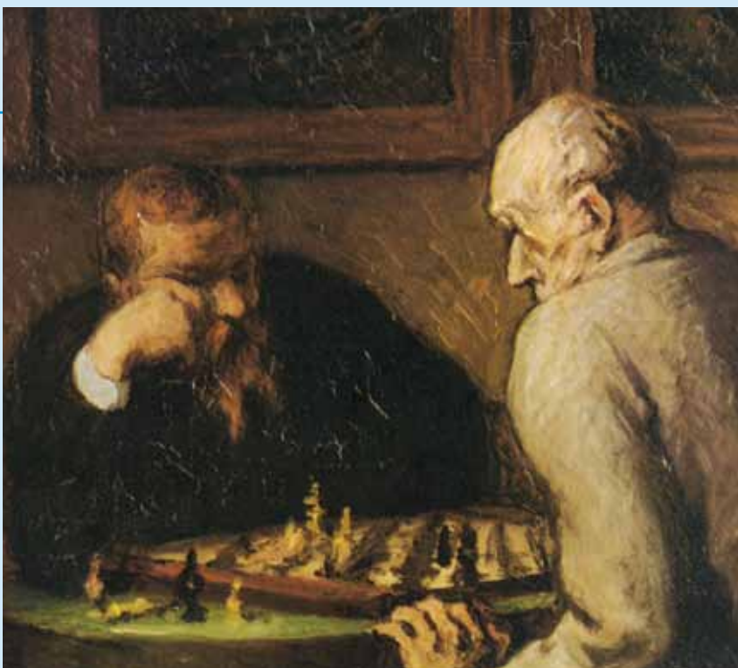
Worum geht es beim synodalen Weg? Den Gegner schachmatt zu setzen? Oder um eine Pattsituation zu zementieren?

Wie Bischof Vorderholzer in seiner „Persönlichen Erklärung“ nach der Abstimmung in der Deutschen Bischofskonferenz (DBK) am 25. September 2019 darlegt, geht die inhaltliche Ausrichtung der vier Foren „an der Realität der Glaubenskrisis in unserem Land“ vorbei. Es werden die „wahren Probleme nicht angegangen“. Es