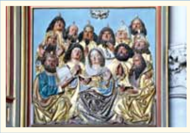
Aussendung des hl. Geistes – Pfingsten (Apg 2,1-3)

Das Relief schnitzte der weitgehend unbekannte Sinniger d. Ä. im frühen 16. Jahrhundert. Es kam wohl aus dem Hl.-Geist-Spital in das Münster zur Schönen Unserer Lieben Frau in Ingolstadt.