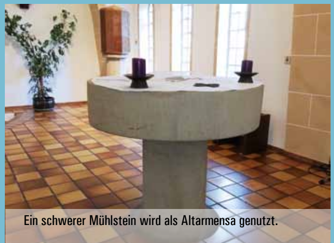
Ein schwerer Mühlstein wird als Altarmensa genutzt.