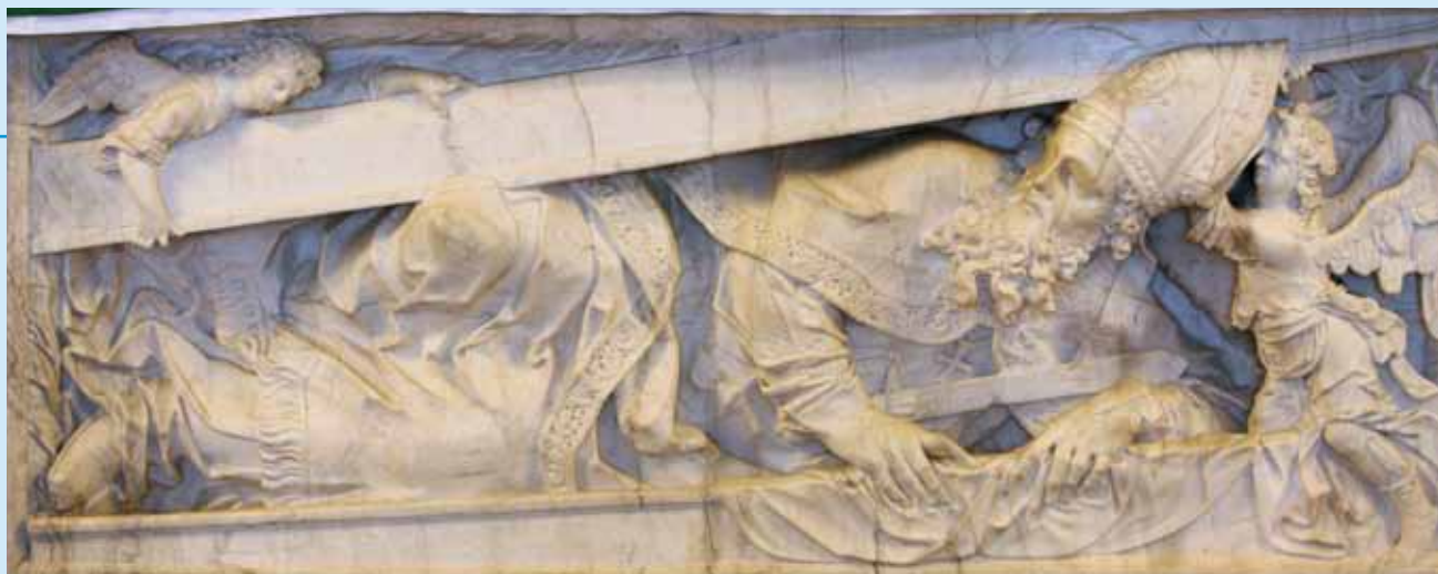
Bonifatius blickt von seinem Grab in Fulda auf die Menschen. Als er nach Deutschland kam, fand er eine „verkommene Kirche“ vor, bei seinem Tod hinterließ er eine „wohlgeordnete und wiederaufblühende Kirche“. Was würde er zum „Synodalen Weg“ sagen?

Der „Synodale Prozess“ deckt die Krise der katholischen Kirche in Deutschland schonungslos auf. Das Konradsblatt (Nr. 25, 21.6.2020), die Kirchenzeitung der Erzdiözese Freiburg, zitiert die FAZ. Dort heißt es ... „Der ‚Synodale Weg‘ mit seinen The-