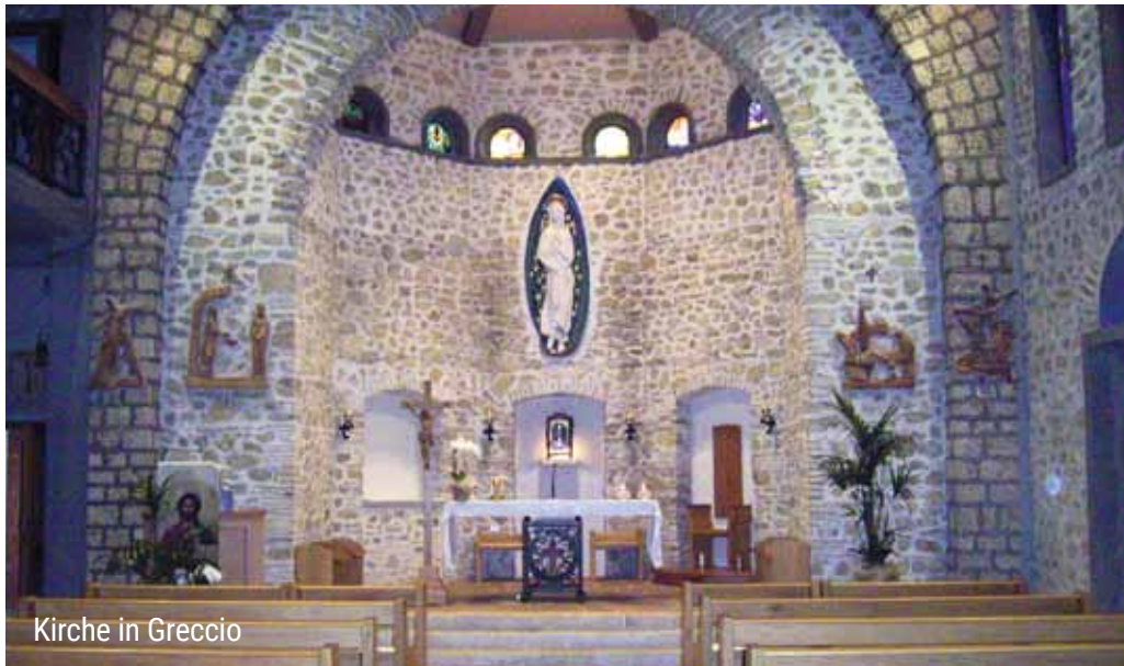
Kirche in Greccio