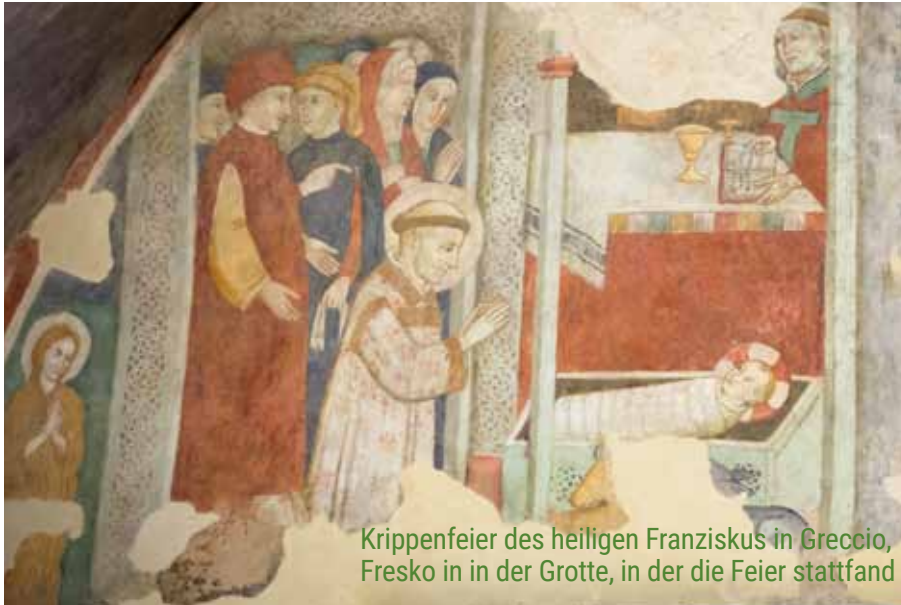
Krippenfeier des heiligen Franziskus in Greccio, Fresko in in der Grotte, in der die Feier stattfand

Ja, auch bei den Ratzingers daheim wurde Weihnachten schlicht und ohne luxuriöse Geschenke gefeiert, aber gerade deshalb verstellte sich nicht der Blick auf das Wesentliche: auf den Erlöser, der Mensch geworden ist. Und erwähnenswert ist auch, dass sich Joseph Ratzinger zeitlebens dem heiligen Franziskus und seiner Frömmigkeit verbunden fühlte. □