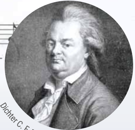
Dichter C. F. Daniel Schubart