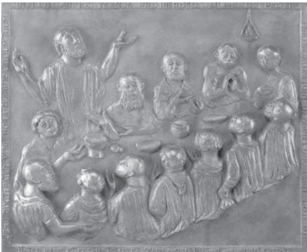
Die Einsetzung der Eucharistie, Kilianschrein, Würzburg. – „Die Einsetzung der Eucharistie nahm auf sakramentale Weise die Ereignisse vorweg, die sich kurz darauf zutragen sollten (...) Wenn die Kirche die heilige Eucharistie feiert, das Gedächtnis des Todes und der Auferstehung ihres Herrn, wird dieses zentrale Mysterium unseres Heiles wirklich gegenwärtig und »vollzieht sich das Werk unserer Erlösung«“ (Enzyklika Ecclesia de Eucharistia 3 und 11).

Die Eucharistie wurde verstanden als Zusammenkunft aller an demselben Ort 8 , also als Vollversammlung der Gemeinde („Zusammenkommen aller am selben Ort“: 1 Kor 14,25). In den Schriften der ersten Jahrhunderte begegnet man immer wieder der Mahnung, der Eucharistiefeier nicht fernzubleiben, wobei weniger die Gleichgültigkeit den Grund für das Fernbleiben gebildet haben dürfte, sondern die Belastungen des Arbeitstages, denen sich Sklaven oder einfache Leute nicht immer leicht entziehen konnten. Das Fernbleiben wird als Hochmut angeprangert, der