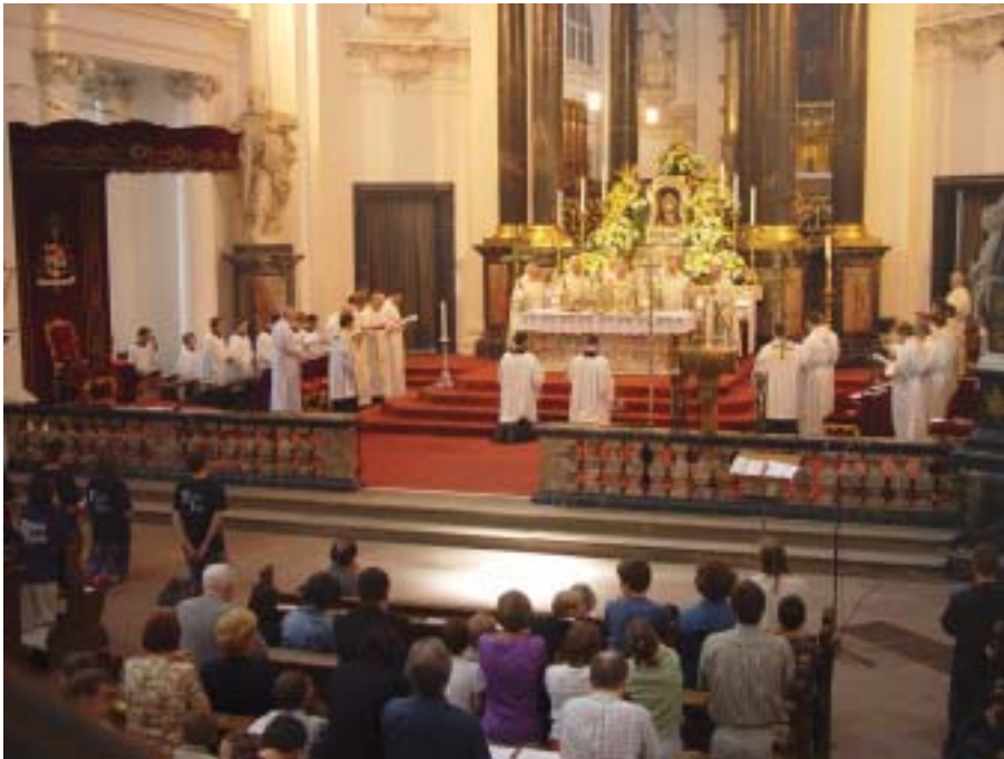
Kongress „Freude am Glauben“ 2003; Eucharistiefeier im Dom zu Fulda. – „Deinen Tod, o Herr, verkünden wir und Deine Auferstehung preisen wir, bis Du kommst in Herrlichkeit.“

dass er an der Gemeinschaft mit Gott teilnehmen und den Tod überwinden kann: all das kann der Mensch nicht aus eigener Kraft bewerkstelligen, sondern muss ihm geschenkt werden.