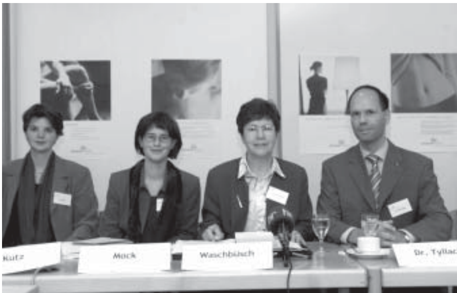
unten: Die Bundesvorsitzende von Donum Vitae mit ihren Mitarbeitern

Chance nicht nutzen und sich in eine bequeme Nische zurückziehen, würde sie ihre Solidaritätspflichten mit der Welt und den Menschen verletzen und „sich mitschuldig an der Tötung ungeborener Kinder machen“ 52 Kritiker einer derartigen Pastoral, die das Abtreibungsstrafrecht instrumentalisiert, um die betroffenen Frauen zu erreichen, waren in der Minderheit. „Staatliche Netze für kirchlichen Fischfang?“ fragte mit Recht der Freiburger Pastoraltheologe Hubert Windisch, für den die kirchliche Mitwirkung an der nachweispflichtigen Schwangerschaftskonfliktberatung eine „potentielle cooperatio formalis“ war, die Gefahr lief, die Kirche in eine „Verkündigungs-pathologie“ zu führen. Der Ausstieg aus dem „Scheinsystem“ sei deshalb die einzige Lösung, um die Freiheit der Verkündigung zurückzugewinnen. 53 Dies war auch die Antwort des Papstes auf die pastoraltheologische Apologie des Beratungsscheines: Es dürfe nicht sein, „dass die Kirche in dieser Sache zuallererst dem Zwang des Staates und der Attraktion des Scheines vertraut. Die Kirche setzt auf Freiheit. Sie setzt nicht auf unangemessene Lockmittel“. 54