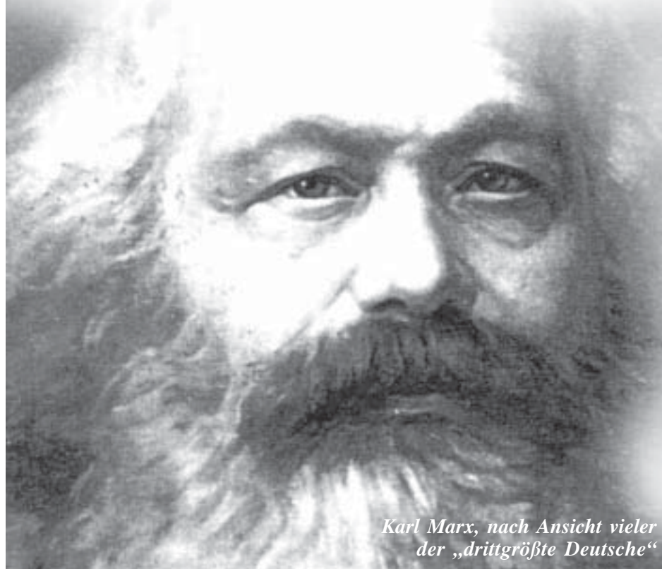
Karl Marx, nach Ansicht vieler der „drittgrößte Deutsche“

Was kann zugunsten des „ganz von Menschlichkeit bestimmten“ Marx vorgebracht werden? Von Nell-Breuning gab zur Antwort: „...den vorstehenden Ausführungen liegen keine Texte oder Meinungsäußerungen von Marx zugrunde, sondern nur heute allgemein verbreitete Erkenntnisse und Denkweisen...“ Andere, wie Richard von Weizsäcker und seine Gewährsleu-