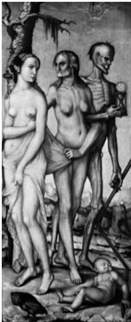
„Die drei Menschenalter und der Tod“ von Hans Baldung Grien zeigen die Vergänglichkeit. Prado, Madrid

Die Heilige Schrift spricht davon: Nach dem Tod trittst du vor das Angesicht Gottes und begegnest der vollkommenen Liebe, Barmherzig-