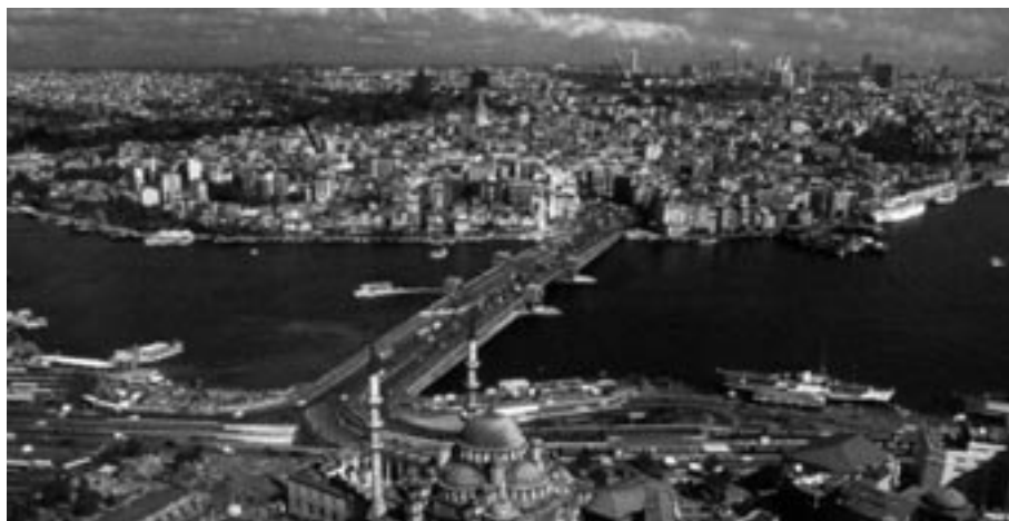
Am Bosphorus in Istanbul: Brücke zwischen zwei Welten oder Brückenkopf für die nächste islamische Welle gegen Europa? Das ist weniger eine Frage der Geographie sondern vor allem des Geistes.

Der Papst wird sich vermutlich kaum in Erklärungen zu Wort melden. Er braucht auch nicht auf die armenische Frage eingehen. Die Präsenz des Papstes an genuin christlichen Orten in der Türkei ist Hinweis genug, dass Rom seine Kinder nicht vergessen hat und dass die Kirche lebt. Politisch ist die armenische Frage und damit die Frage nach der Religionsfreiheit in der Türkei für die Europäer sowieso schon zum entscheidenden Kriterium für weitere Verhandlungen mit der EU geworden. EU-Politiker, die den Beitritt der Türkei seit Jahren vermutlich auch aus Hass gegen die Kirche betrieben haben, kommen immer stärker in Bedrängnis und verlieren gelegent-