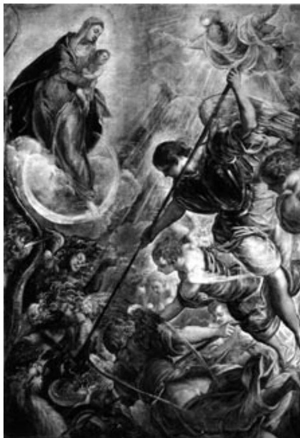
Tintoretto „Der Kampf des Erzengels Michael mit dem Satan“, Staatliches Kunstmuseum Dresden

Jean-Luc Marion macht in seiner Darlegung „Das Böse in Person“ auf die heute verbreitete Anklage mentalität aufmerksam, die immer Schuldige braucht und findet und sich rächen will; diese Rachehaltung führe bis