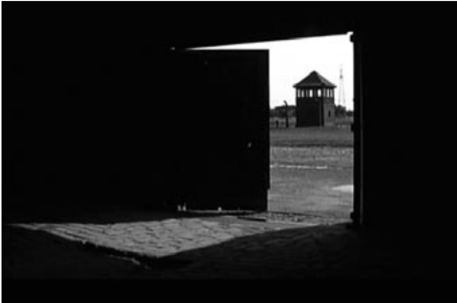
Max Frischs Hauptangriff ist nicht gegen den judenfeindlichen deutschen Nationalsozialismus gerichtet.