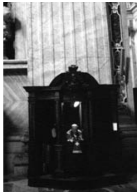
Er war der Papst der Barmherzigkeit und liebte das Sakrament der Vergebung: Johannes Paul II. in einem Beichtstuhl seiner „Pfarrkirche“, des Petersdoms.

- Versuchen Sie, zehn Minuten am Tag zu finden. Es lohnt sich. Vielleicht schauen Sie einfach zehn