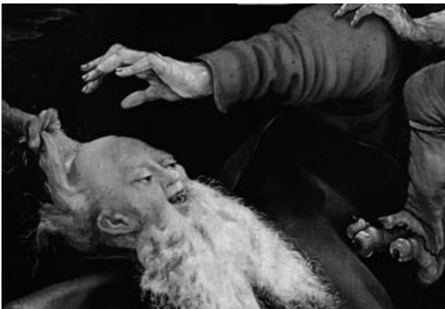
„Die Versucheung des hl. Antonius“ auf dem Isenheimer Altar von Matthias Grünewald

Jedoch die große Weltmacht kann die Märtyrer nicht bezwingen; sie sind „kraft des Blutes des Lammes“ stärker als alle Macht und Verführung der Welt. Sie beten das Tier nicht an (Kap. 13). So weiß Satan, dass er besiegt ist, verschärft aber seine Angriffswut; die