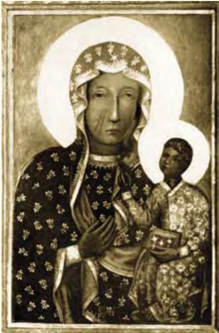
Links: Das Gnadenbild Unserer Lieben Frau von Tschenstochau, der „Königin Polens“