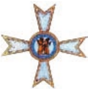
Bruderschaft der heiligen Apostel Petrus und Paulus