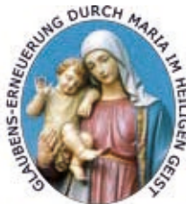
KÖNIGIN DER LIEBE DEUTSCHLAND e.V.